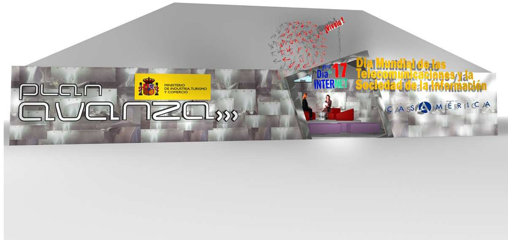
Exterior plató digital