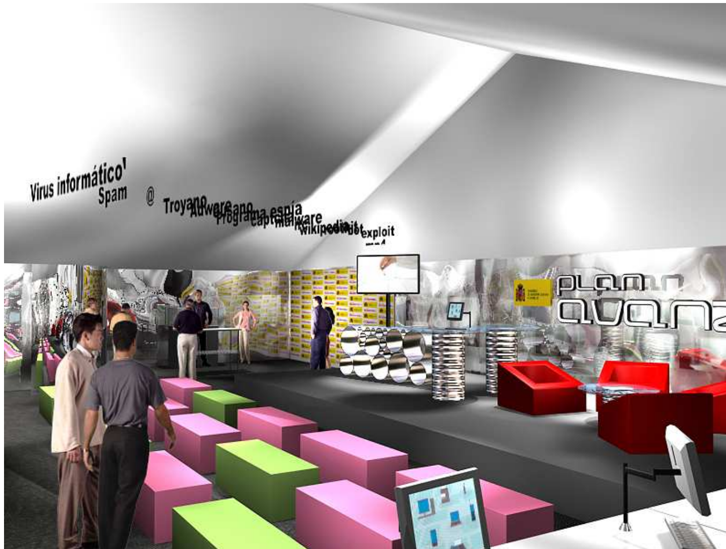
Interior plató digital