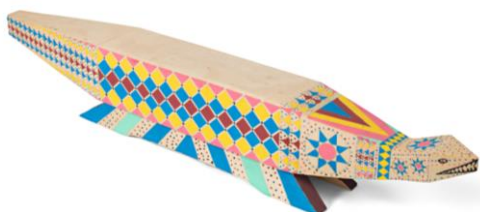
kadeikaru (animal mítico) Galibi Marworno. Autoria desconhecida, madeira, 23 x 17 x 150 cm