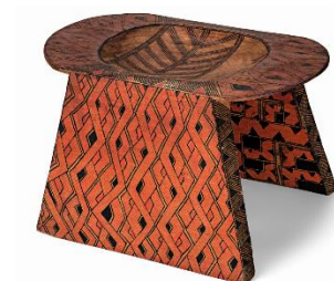
Banco Asurini do Xingu. Autoria desconhecida, madeira, 34 x 28 x 46 cm