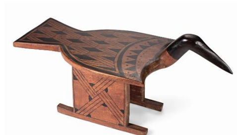
Jaburu Kamayurá. Yawapi Kamayurá, madeira, 47 x 41 x 94 cm