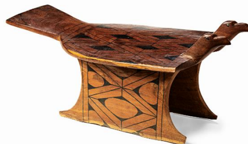
Gavião de duas cabeças Yawalapiti. Pirakuma Yamalapiti, madeira, 47 x 49 x 108 cm