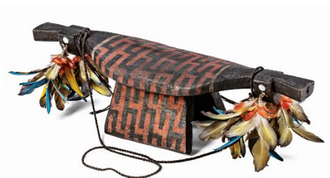
Banco Karajá. Autoria desconhecida, madeira, 17 x 17 x 59 cm