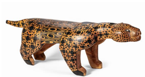
Onça Mehinaku. Karaputa Michel Mehinaku, madeira, 53 x 43 x 163 cm