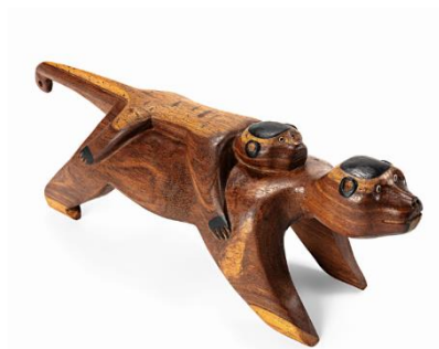
Macaco Waujá. Turuza Waurá, madeira, 26 x 23 x 78 cm