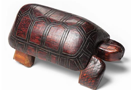
Jabuti Tapirapé. Autoria desconhecida, falso pau brasil, 23 x 25 x 47 cm